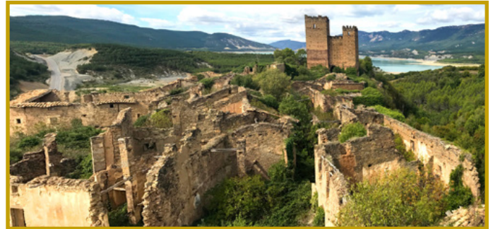
Rehabilitación de la aldea de Ruesta (Zaragoza)