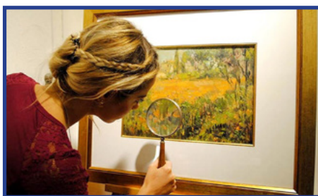
Historiador del Arte