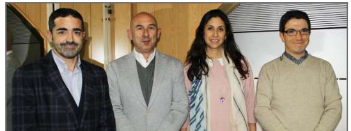
Presidente Junta Directiva