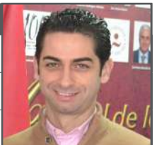
Presidente Junta Directiva