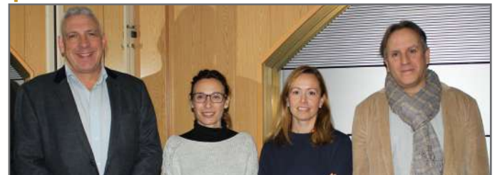
Presidente Junta Directiva