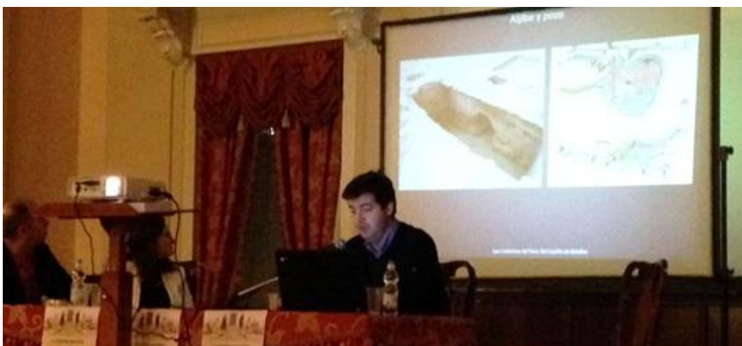
Momento de la exposición realizada por Ángel Aranda Palacios

En su conjunto, el estudio del material de las cerámicas recuperadas en el interior del foso del castillo de Doña Berenguela en Bolaños de Calatrava pone de manifiesto una gran homogeneidad de formas, acabados y decoraciones, la mayoría se sitúa cronológicamente entre los siglos XIII, XIV y principios del XV, algunas formas de clara tradición islámica, aunque nos encontramos con un grupo de clara filiación cristiana.