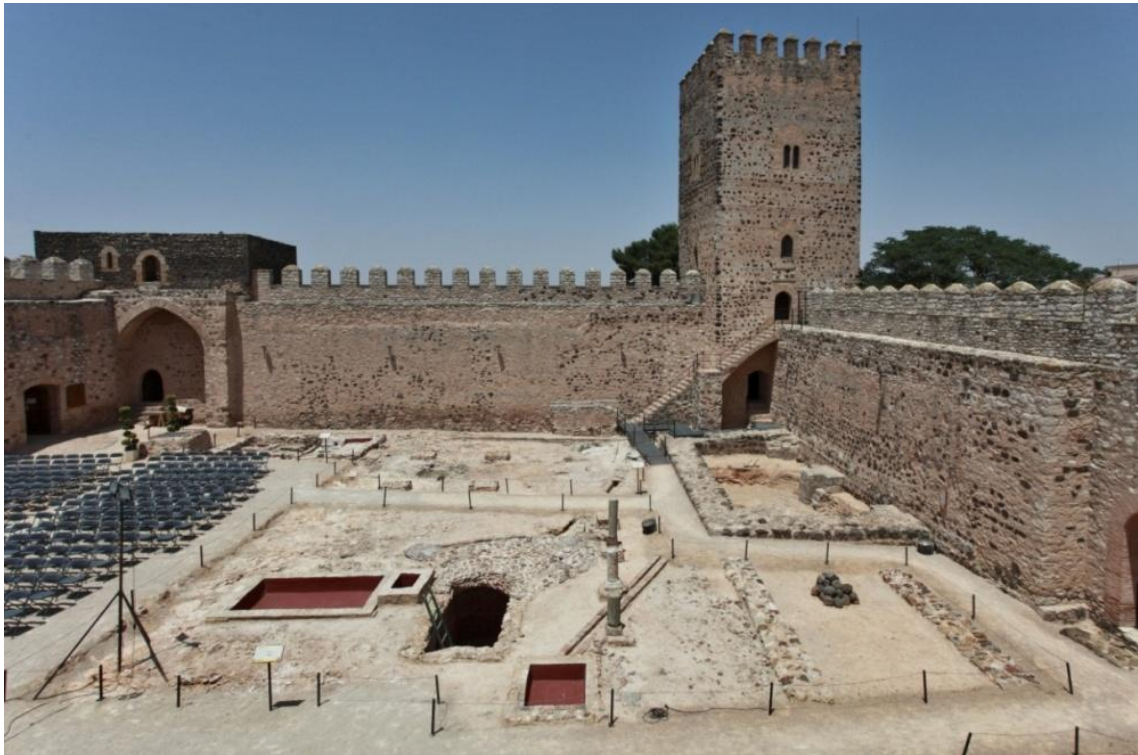
Aspecto del interior del castillo.